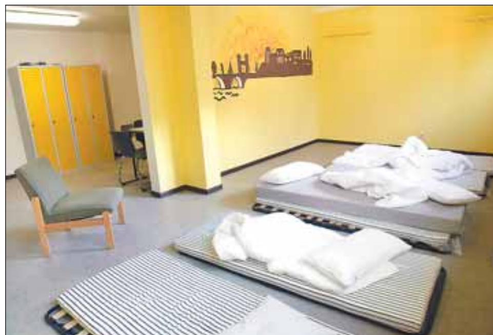
Nicht gerade komfortabel: Ein Notquartier im Wohnheim-Gemeinschaftsraum.