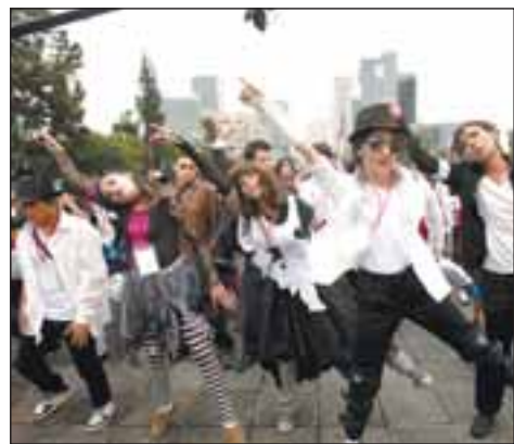
Weltweit tanzen am Samstag zum Michael Jackson-Hit „Thriller“.

RNZ. Er war unumstritten der King of Pop: Michael Jackson. Sein legendärer Tanzstil faszinierte über Jahrzehnte die Welt. Auch zwei Jahre nach seinem Tod huldigen Millionen Menschen noch diesem musikalischen Genius. Eine besonders unterhaltsame Variante ist das bereits seit 2006 alljährlich stattfindende Tanz-Event „Thrill the World“. Als Zombies verkleidet tanzen Menschen allen Alters rund um den Globus gleichzeitig zum Jackson-Hit „Thriller“ und versu-